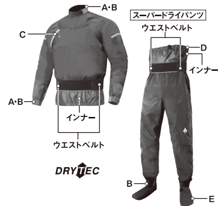
スーパードライトップ