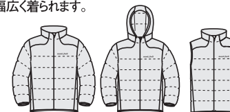
ジャケット男性用 パーカ男性用 ベスト男性用