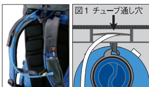
図1 チューブ通し穴