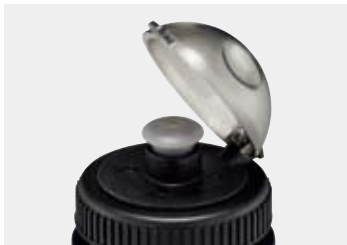
プルトップキャップクリアボトル用 (#1124393 別売り)を取り付けると 片手で飲みやすくなります。