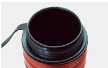
氷等を入れたり、中を洗いやすい 広口構造。