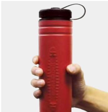
細身のデザインで握りやすい。