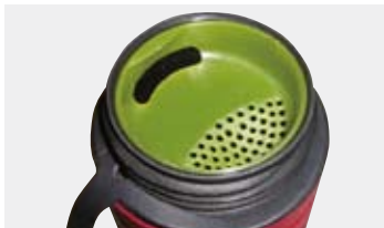
クリアボトルインナーキャップ (#1123616 別売り)を取り付けると ボトルの中身が一気に口に流れ込 むのを防ぎ、茶葉等をこして飲むこ とも出来ます。