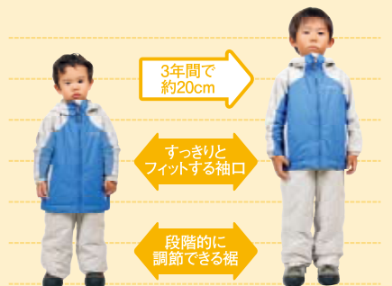
パウダーライトジャケット&ピブ 同サイズ(110)着用時

Jr.&Kid'sサイズの子どもの成長は、3年間に平均で約20cm。その成長に合わせて、約4シーズン使用可能なシステムを採用しました。(特許出願中)