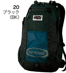
20 ブラック (BK)

30 #1223370 ¥9,240 【容量】30L(高さ61×幅30×奥行き19cm) 【重量】672g 【背面寸法】50cm 40 #1223369 ¥13,400 【容量】40L(高さ69.5×幅30×奥行き20cm) 【重量】1,09kg 【背面寸法】52cm 沢登りなどで活躍するメッシュバックです。水に濡れても保水しないディーツピングメッシュを全面に使用。水抜きの良さと軽量化を実現しています。