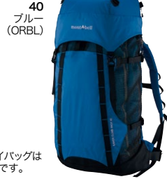
40 ブルー (ORBL)