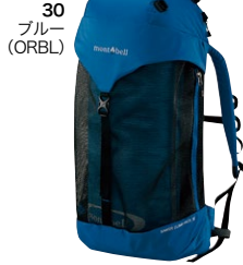
30 ブルー (ORBL)

#1125125 ¥4,290 【サイズ】XS,S,M,L,XL 【重量】51g 手のひら全体に高い耐久性とグリップ力を備えるケブラー®の一枚地を使用した、沢登り専用グローブです。指先をカットすることで、優れた操作感覚を実現しています。