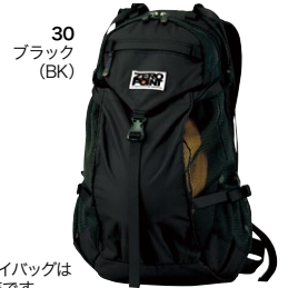
30 ブラック (BK)