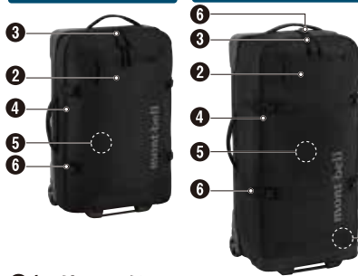
ウィーリーダッフル90