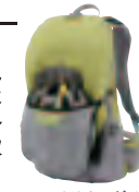
※ヘルメットはイメージです。

ストレッチ生地が全面を包むように押さえ、装着時に安定するヘルメットホルダー。使用しないときは収納出来ます。