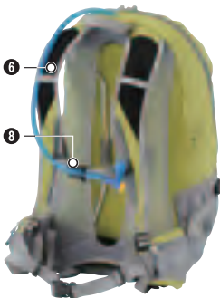
※ハイドレーションバックはイメージです。