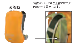
背面のバックルと上部の2カ所のホックを固定します。