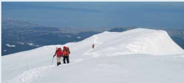
日本海を背に山頂へ向かう／大山