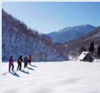
白い山里にたたずむ合掌づくり／白川郷