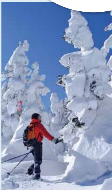
雪におおわれて、まるで生き物のように見える樹木／八幡平

“雪山”というと、厳しくストイックな響きがあり、初心者には近寄りがたいイメージがあります。実際、雪のフィールドは甘いものではありませんが、一部の特別な人にしか行けない場所ばかりでもないのです。初心者でも十分に楽しめるフィールドがたくさんあって、自分のレベルに合うところからスタートすることで徐々に雪山に慣れ、必要な知識・経験・技術・装備なども身につけてゆきます。気付いたときには、はじめは行くことのできなかつたフィールドで、より深い感動を味わえるようになっていくでしょう。