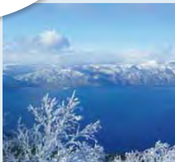
湖と四方に広がる白い山並み／北海道