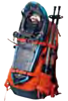
スノーシュー 装着例

ランドナーバック 33 雪山に必要なギアや装備を機能的に携行できるバック。 ¥14,800 (税込) #1223351