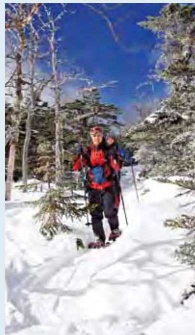
紺碧の空と純白の雪景色／北八ヶ岳