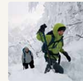
ピッケルを使用する 山岳登山