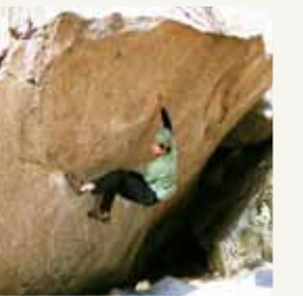
ボルダリングなどの クライミング