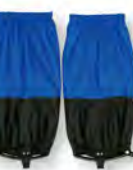
フライマリブルー

¥1,900 (税込) #1108753 Women's カラー: 4色 / サイズ: S・M