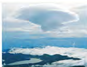
大きな過伏の雲(吊し雲)。高い確率で天候が劇変することを教えてくれる雲です。

富士山頂の平均気温は夏でも平均6℃前後と、都会の真冬と変わらない寒さです。防寒装備が不十分だと体温を奪われ、運動能力や判断力の低下、衰弱など、危険な状態に陥ります。防風雨対策に有効な、上下分かれたタイプのレインウェアが必須なのはもちろん、防寒のためのウェアや手袋も必ず準備しましょう。