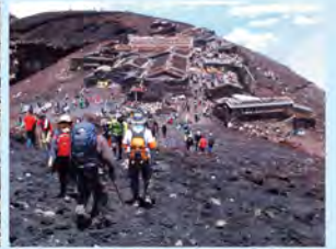
富士山頂・お鉢めぐりの様子