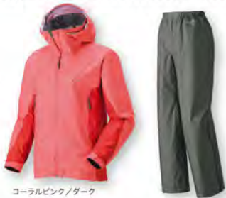
コーラルピンク/ダーク

高性能に加え大幅な軽量化を実現した全天候型のジャケットと同素材のパンツ。細部にまでこだわったモンベルレインウエアの代表作です。