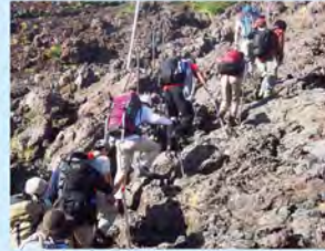
急な岩尾根を登る8合目付近