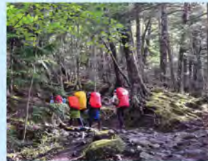
苔むした緑が美しい1合目からの登山道