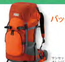
サンセットオレンジ