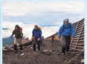
つづら折りに登る6合目付近