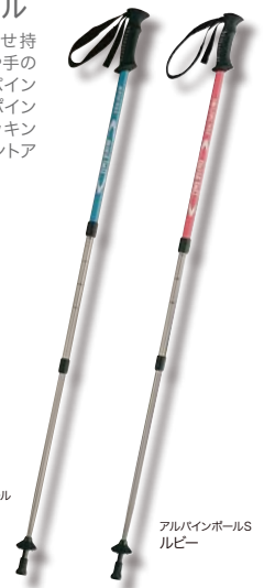
アルパインポール バルサム