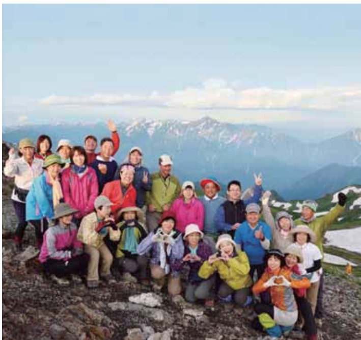
白馬岳山頂より剣岳を背に1枚