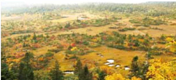
八甲田山・下毛無岳