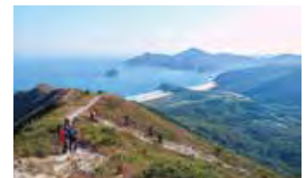
シャープピークからの下り