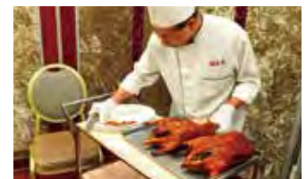
北京ダックなど北京料理の夕食