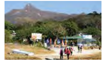
大浪湾(タイロンワン)の海岸で昼食