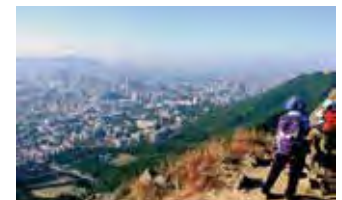
絶景のピーク獅子山(ライオンロック)