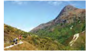
タイロンアウからシャープピークの山頂へ