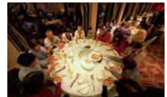
香港グルメも楽しみの一つ