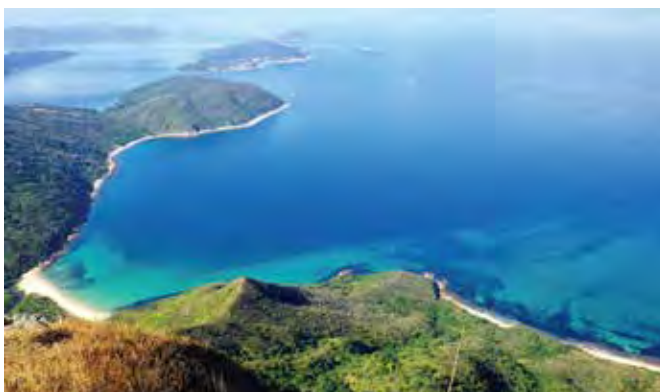
シャープピーク頂上付近からの眺め