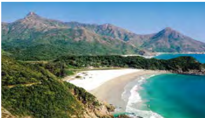
美しい砂浜と青い海の奥にそびえる香港の名峰シャープピーク

香港の魅力は、多彩な食や夜景を楽しんでこそ思い出深いものになります。宿泊するホテル周辺には、格安で味わえる庶民的なレストランから、山海の豪華な食材が楽しめるミツ星レストランまで、よりどりみどりで。格式高い“ペニンシュラ・ホテル”のアフタヌーンティーは特に有名です。また、宿泊するホテルから徒歩圏内にある香港の目抜き通り“ネイザンロード”は、夜には色とりどりのネオンが輝き、散策にはもってこいです。夜景のなかでも香港島にあるビクトリア・ピークから眺める「100万ドルの夜景」は見逃せない香港の魅力です。